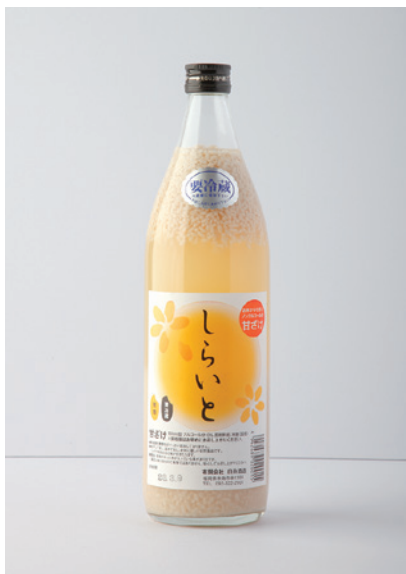
しらいとのあまざけ： 価格770円 賞味期限 製造日より6週間 内容量900ml 原材料 米糀(国産)

酒蔵の品質の高い酒粕を使い、丸一昼夜一定の温度で寝かせます。あまざけでは非常にめずらしい、糀と水だけを原料とした酒蔵ならではの本格的な仕上がりとなっています。白い糀がきれいに残っているのも、しらいとのあまざけの特徴です。添加物・糖類を一切加えていないため、低カロリーな仕上がりで、自然な甘さがやさしく、お子様からお年寄り・授乳中の方にも安心してお召し上がりいただける自然食品です。